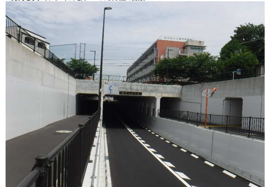
※桜木中学校（南側）から望む